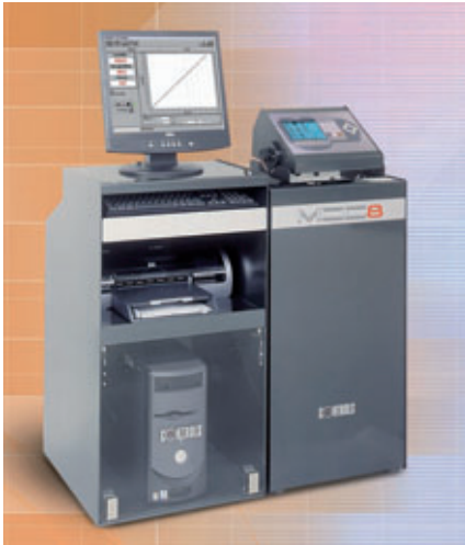
Fig. 2: Unidad servo-hidráulica del control automático MCC8