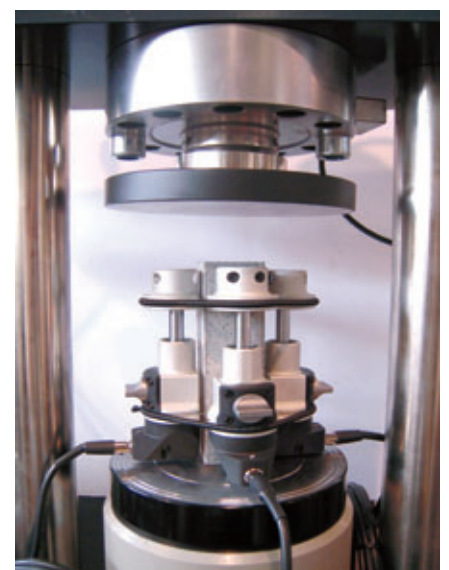
Fig. 1: Muestras de hormigón y mortero equipados con sensores de alta precisión 55-C0222/F para el ensayo de ME